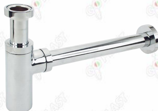
Immagine a puro scopo illustrativo.