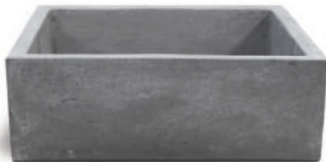
Nero Antracite MADRID N