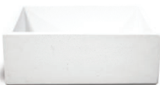
Bianco MADRID B

Il lavello Madrid ha una rientranza sul lato posteriore per l'installazione della staffa a scomparsa sta.nascosta