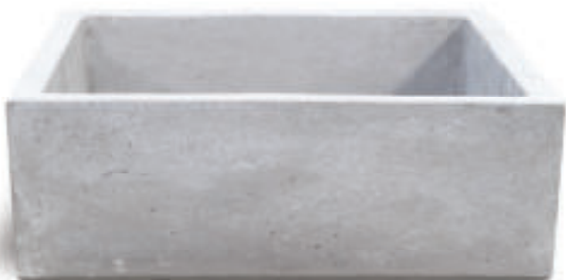
Grigio MADRID G