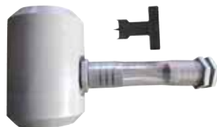
FILTRO PLUVIALE CON SET DI COLLEGAMENTO

Il kit per recupero acqua piovana consente di trasformare il serbatoio MODELLO ANFORA SENZA FORI in un sistema per il recupero dell'acqua piovana direttamente collegato alle grondaie dell'edificio.