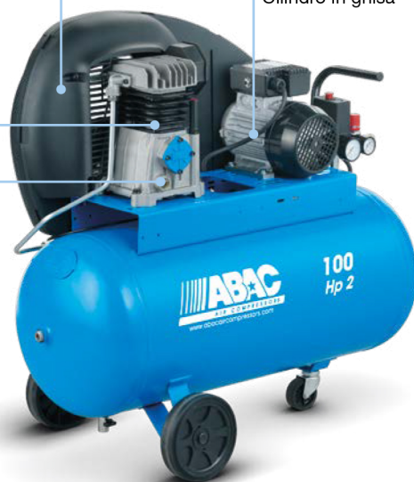
A29 100 CM2 2 hp, 100 litri