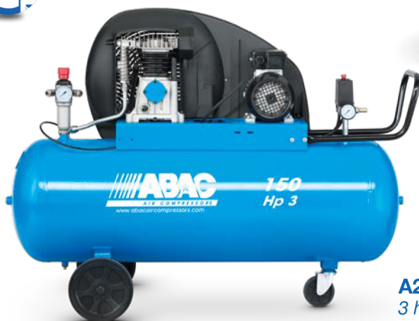
A29B 150 CM3 3 hp, 150 litri