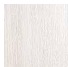
ROVERE SBIANCATO 022