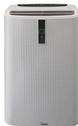
Pompa di calore e Classe energetica