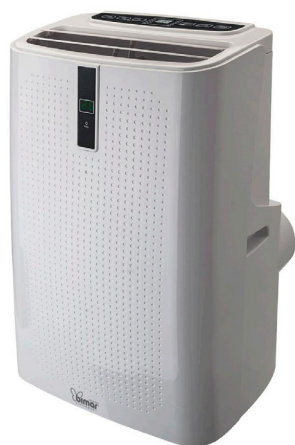
4 Funzioni, un unico apparecchio