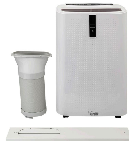
Kit finestra incluso