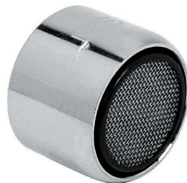
Immagine a puro scopo illustrativo.