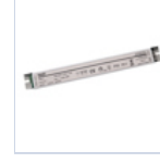
4721 DRIVER PUSH TO DIM 24VIP20 30W