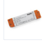
4714 DRIVER ISOLATO 24V IP20 200W