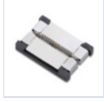
56620 CONN STRIP TO STRIP 10PZ