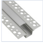
56692 PROFILO CARTONGESSO RASATURA