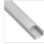
56694 PROFILO 2MT STRIP PLAFONE