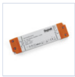
4710 DRIVER ISOLATO 24V IP20 60W