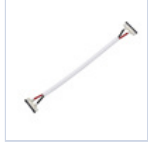
56622 CONN STRIP TO STRIP FILO 4PZ