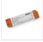
4712 DRIVER ISOLATO 24V IP20 100W