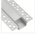
56693 PROFILO CARTONGES RASATO LARGO