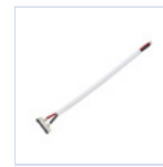
56621 CONN STRIP TO DRIVER 5PZ