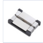
56620 CONN STRIP TO STRIP 10PZ