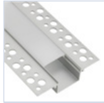
56693 PROFILO CARTONGES RASATO LARGO