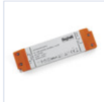
4709 DRIVER ISOLATO 24V IP20 30W