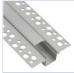
56692 PROFILO CARTONGESSO RASATURA