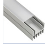
56628 PROFILO 2MT STRIP DISSIPATORE