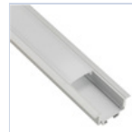
56695 PROFILO 2MT STRIP INCASSO