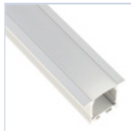
56696 PROFILO INC FONDO CARTONGESSO