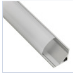
56627 PROFILO 2MT STRIP ANGOLARE