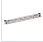
4721 DRIVER PUSH TO DIM 24VIP20 30W