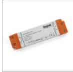
4714 DRIVER ISOLATO 24V IP20 200W