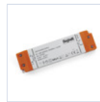
4720 DRIVER ISOLATO 24V IP20 320W