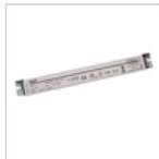
4722 DRIVER PUSH TO DIM 24VIP20 60W