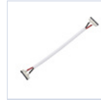
56622 CONN STRIP TO STRIP FILO 4PZ