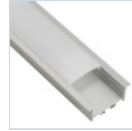
56691 PROFILO CARTONGESSO CON MOLLE