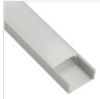
56690 PROFILO PLAFONE LARGO