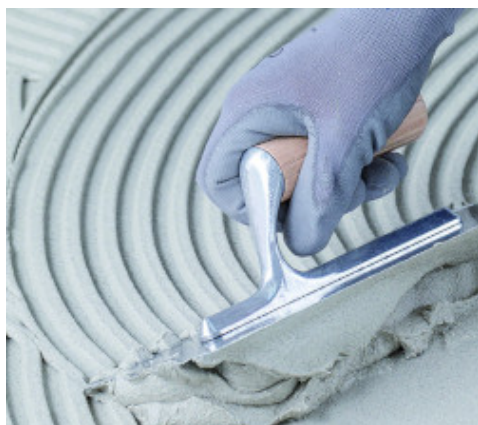
Stesura di Adesilex P9 bianco