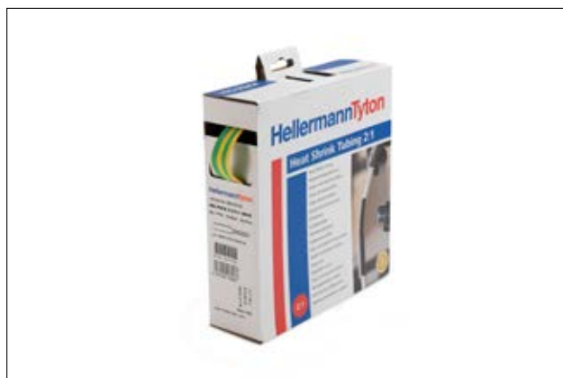
HIS Pack Tubi termorestringenti 2:1 Scatola dispenser. Si adatta perfettamente.