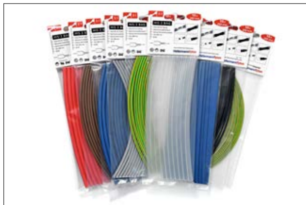
HIS-3 BAG disponibile in sette colori e quattro misure.