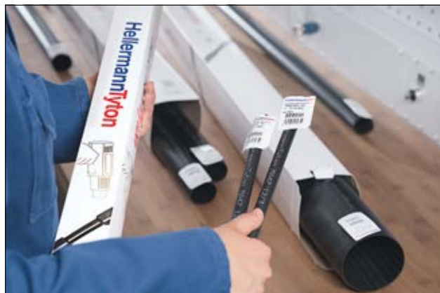
TREDUX MA47 in comodi cartoni da esposizione.