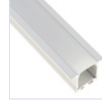
56696 PROFILO INC FONDO CARTONGESSO