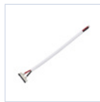
56621 CONN STRIP TO DRIVER 5PZ