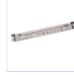
4722 DRIVER PUSH TO DIM 24VIP20 60W