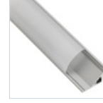
56627 PROFILO 2MT STRIP ANGOLARE