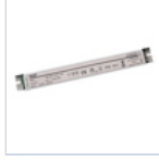
4721 DRIVER PUSH TO DIM 24VIP20 30W