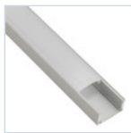
56694 PROFILO 2MT STRIP PLAFONE