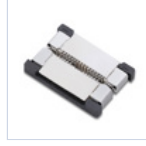
56620 CONN STRIP TO STRIP 10PZ