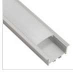
56691 PROFILO CARTONGESSO CON MOLLE