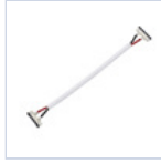
56622 CONN STRIP TO STRIP FILO 4PZ