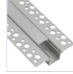
56692 PROFILO CARTONGESSO RASATURA