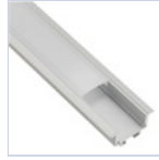
56695 PROFILO 2MT STRIP INCASSO