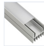
56628 PROFILO 2MT STRIP DISSIPATORE