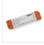
4714 DRIVER ISOLATO 24V IP20 200W