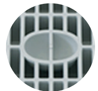
Elemento di presa della griglia