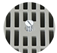
Dettaglio apertura con bullone